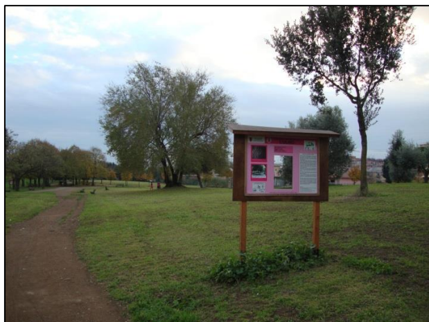
Uno dei nuovi tabelloni del Percorso

Nel novembre 2013, a dieci anni dalla sua installazione, sono terminati i lavori di rifacimento dei tabelloni illustrativi del Percorso Verde Ambientale del Parco Palatucci di Roma. La nuova sistemazione, finanziata dal Dipartimento Tutela Ambientale e del Verde – Protezione Civile di Roma Capitale, è stata realizzata con la Direzione dei Lavori di Giuseppe Di Millo, coadiuvato dai tecnici Fabio Canneta e Federico Savi, su progetto di Fabio Maialetti.