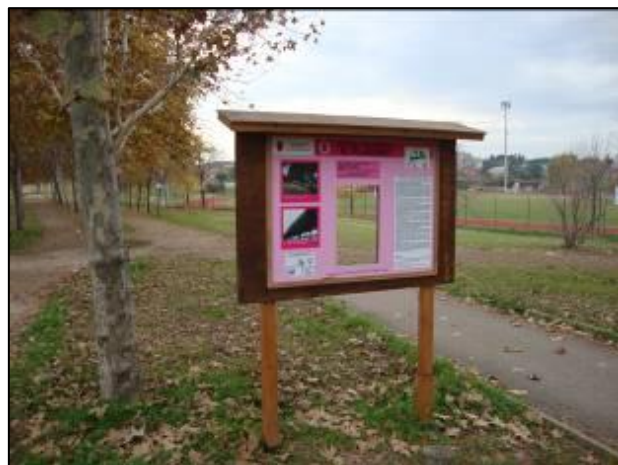
Seguendo il Percorso Verde Ambientale

È un piccolo segnale positivo in controtendenza che risponde alle aspettative di valorizzazione e sviluppo delle grandi risorse ambientali ancora presenti nelle aree periferiche della Capitale, risorse che, a causa della persistente crisi economica, rischiano di essere abbandonate al degrado. Non regge più la giustificazione secondo cui mancando le risorse non si può intervenire. La classe politica, il mondo della cultura e dell'educazione, devono svolgere la propria funzione di indirizzo proponendo soluzioni nuove, che puntino (didascalia Uno dei nuovi tabelloni del Percorso) a valorizzare le risorse professionali interne alle amministrazioni locali e dare credito con convinzione al coinvolgimento dei cittadini nello sviluppo attività di cura del verde. Le periferie delle grandi città italiane stanno implodendo paurosamente soprattutto per quanto riguarda la produzione di momenti culturali legati all'ambiente significativi, non di facciata. È perciò necessario recuperare al più presto un certo spirito di iniziativa e di servizio: per realizzare questo cambiamento, che non ha timore di affrontare la crisi, bisogna fare appello a tutti coloro che hanno a cuore il patrimonio ambientale.