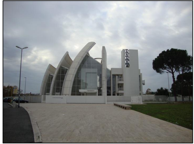
La Chiesa 'Dio Padre Misericordioso'

fruizione dell'ambiente naturale, storico e archeologico del Parco da parte dei bambini e delle bambine, (Didascalia La Chiesa 'Dio Padre Misericordioso') come dei ragazzi e degli adulti, affinché questi si sentano parte di un territorio che, a dispetto della cattiva considerazione che è superficialmente attribuita alla periferia e alle comunità che ci vivono, è invece ricco di risorse ecologiche, storiche, archeologiche e, non ultime, umane.