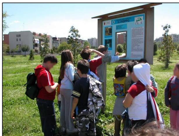
Uno dei tabelloni nel corso di una visita guidata al Parco

Con il medesimo fondo fu contestualmente finanziata l'istituzione di un Centro di Educazione Ambientale (CEA), inizialmente ospitato nei locali messi a disposizione dalla Scuola Media Statale di via Olcese, e la pubblicazione di un opuscolo informativo, che illustrò in maniera articolata i temi proposti con la realizzazione del Percorso, intitolato 'Itinerari verdi Nel VII Municipio, Ambiente, Storia, Cultura'.