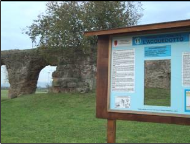
Tabellone che descrive l'Acquedotto Alessandrino